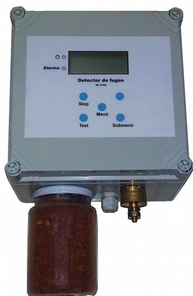
Panel de control

Opcionalmente se puede suministrar con manifold neumático para la conexión de hasta 5 depósitos al mismo equipo.